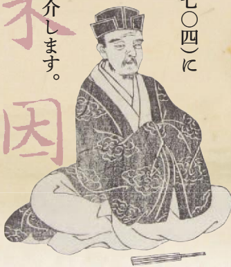
左:木因 右:芭蕉(当館蔵「俳諧百一集」)