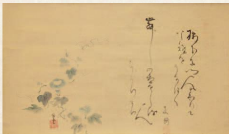
洞竹画・木因賛「舞の」句画賛(個人蔵)