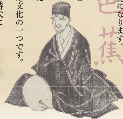
背景:芭蕉筆「ひよろひよろと」句画賛(個人蔵)