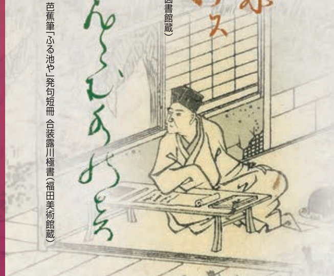
【俳人百家撰】(当館蔵)